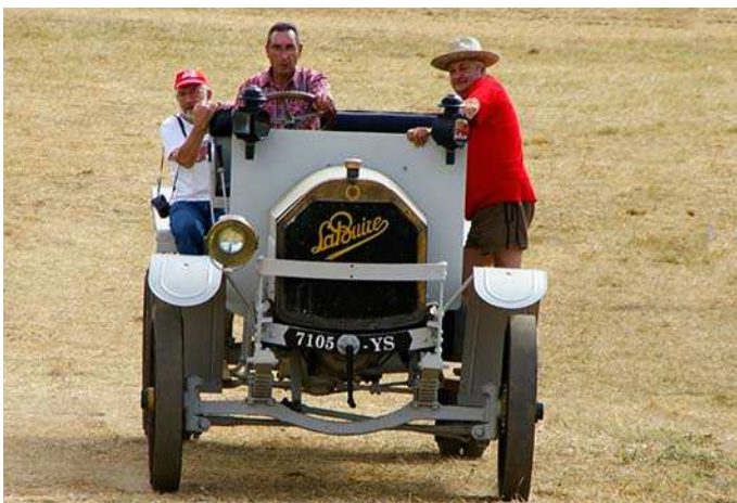
Le gazogène des frères Rigal. Belle restauration.