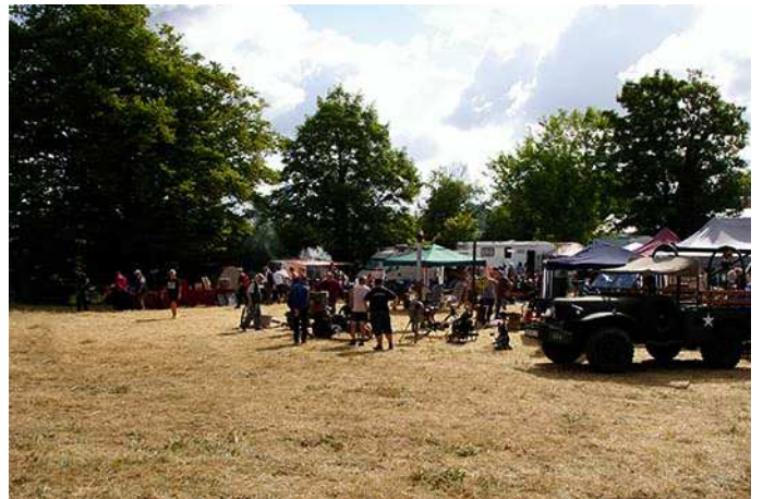
Au petit matin réveil difficile, mais il faut se lever, car il faut faire le tour du propriétaire.