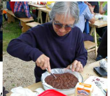
A bientôt pour de nouvelles aventures avec le CAR !