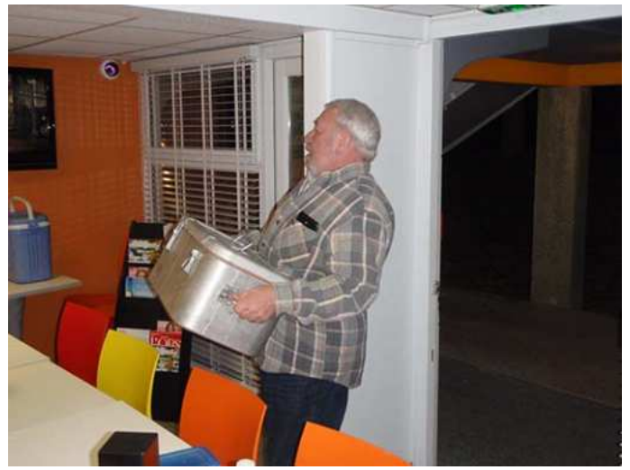
Les apprentis cuisiniers !...