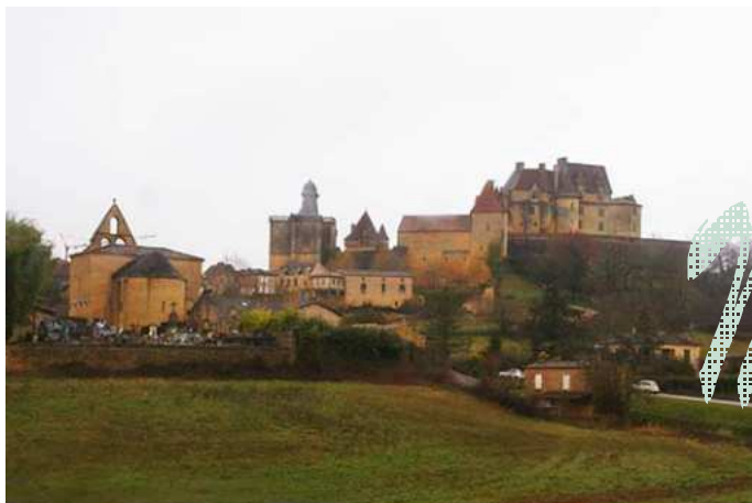
Le château BIRON