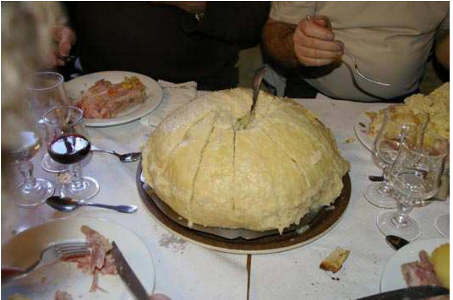
La reine de la journée, LA MIQUE