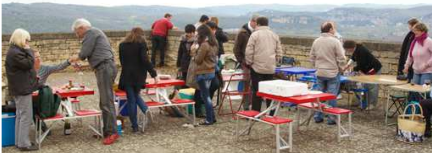
Fin du casse-croûte et retour au bercail par La Roque-Gageac avec en prime quelques réglages d'une des deux Bugatti, mais rien de méchant.